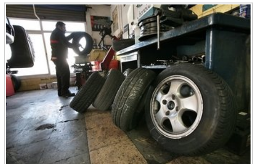
Imagen de un taller neumático de Cornellá Maite Cruz