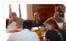
La inversión en Asturias, el 12 de julio