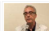
Millás analiza el mundo digital