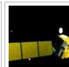
China manda dos satélites al espacio