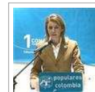
Cospedal carga contra el PSOE por la economía