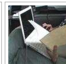
Los portátiles pueden causar "mal de la piel tostada"